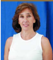
Marta Oyhanarte, Subsecretaria para la Reforma Institucional y Fortalecimiento de la Democracia